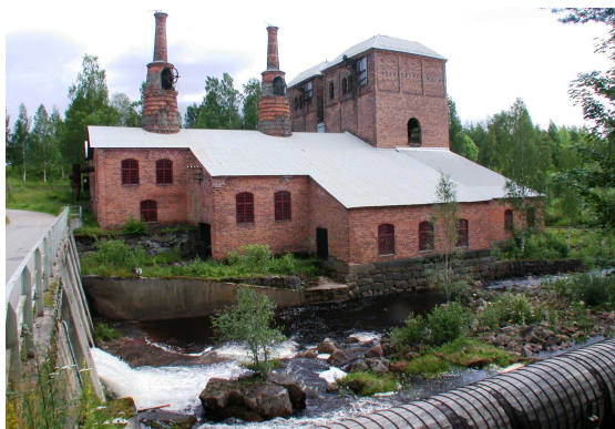
Jädraås masugn.

öI mitten av 1800-talet ersattes namnet Vannamylle med Jädraås. Men det gamla skogsfinska namnet lever kvar i bygden trots vårfloder och språkets försvinnande.ö